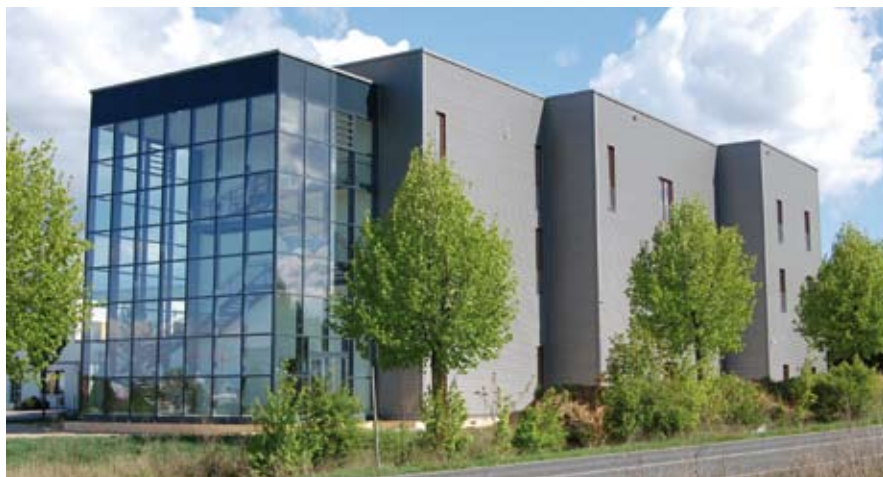
Kunstgebäude CADORO in fase di completamento, aprile 2014

All'ultimo piano dell'edificio si apre, ampio, luminoso e leggero come le nuvole oltre la vetrata del suo tetto, il nuovo atelier dell'artista Lore Bert. Un luogo sereno e fuori dal tempo, dove si avrebbe voglia di restare per sempre.